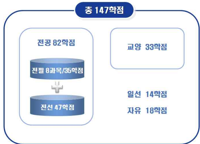
[그림 12] '예시 7'의 총학점 구성도