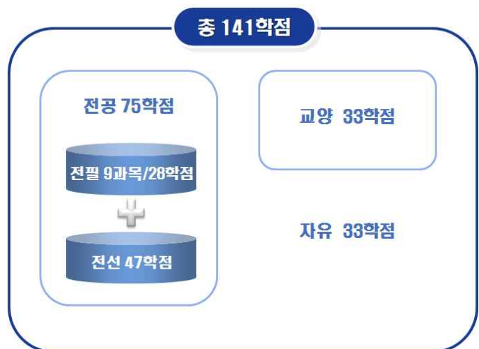
[그림 11] '예시 6'의 총학점 구성도