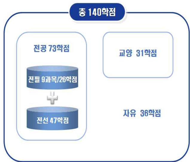
[그림 6] '예시 1'의 총학점 구성도

○ 수강신청기간, 수강료 등 등록 제반사항은 수강을 희망하는 교육훈련기관 혹은 대학으로 문의하여야 함.