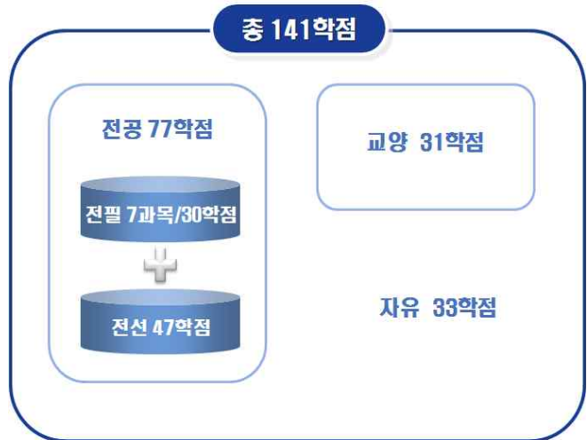
[그림 7] '예시 2'의 총학점 구성도