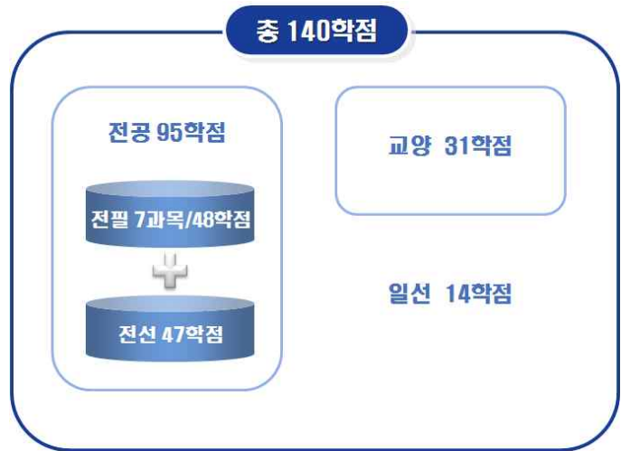
[그림 10] '예시 5'의 총학점 구성도