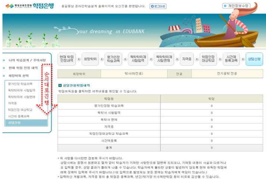
[그림 13] 온라인 학습설계 시스템