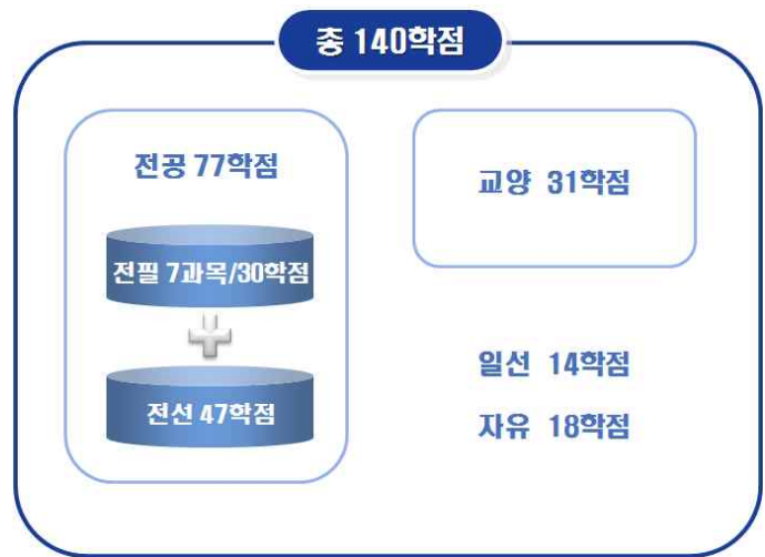
[그림 8] '예시 3'의 총학점 구성도