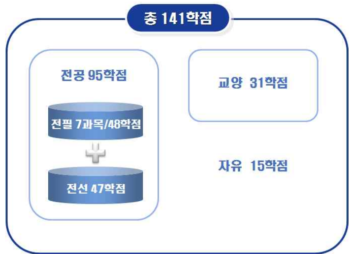
[그림 9] '예시 4'의 총학점 구성도